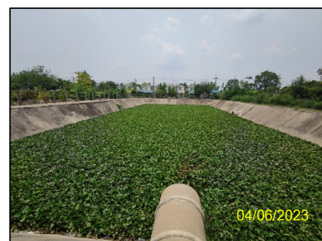
บ่อหนองน้ำ