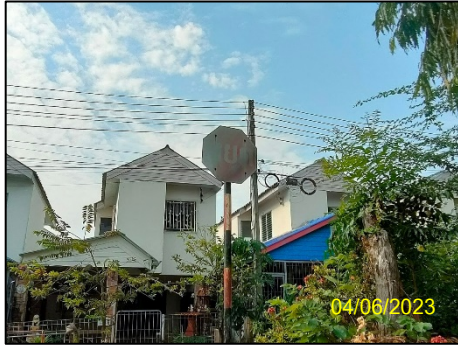
ลักษณะหน่วยพักอาศัย