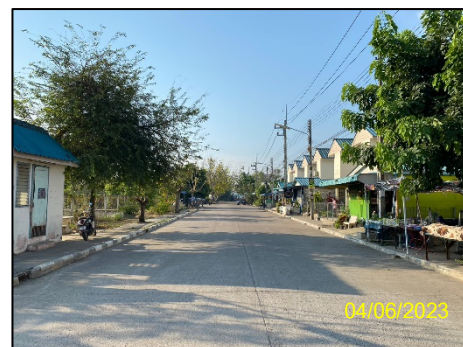
ถนนและทางเท้า