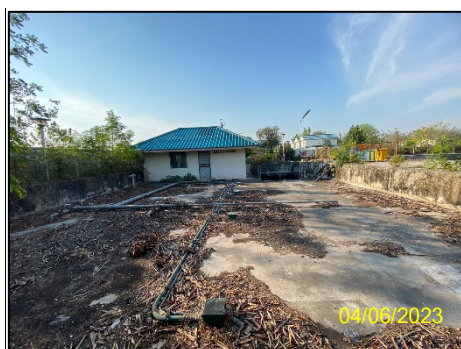
พื้นที่บ่อบำบัดน้ำเสีย