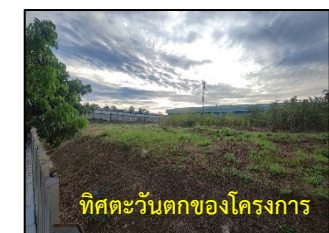
รูปที่ 1-2 ผังบริเวณโครงการบ้านเอื้ออาทร จังหวัดชลบุรี (บ้านเกาะโพธิ์)