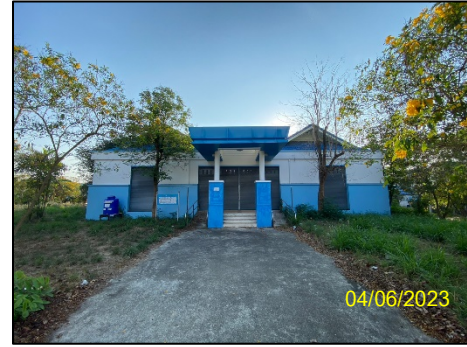
ศูนย์ชุมชน