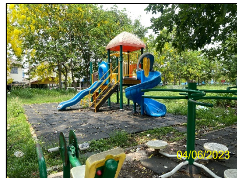
สนามเด็กเล่น